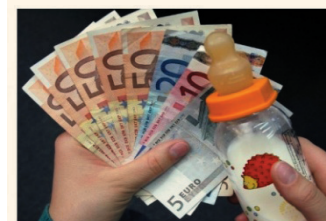
کشورهای مختلف برای کمک اقتصادی به خانواده‌هایی که بچه‌دار می‌شوند برنامه‌های خاصی خود را دارند

دولت انگلیس برای مزایای بچه‌دار شدن تلاش کرده است که حقوق را به صورت هفتگی برای پدر و مادرها در نظر بگیرد. این حقوق از آوریل سال ۲۰۱۰، برای بچه اول ۲۰/۳ پوند به صورت هفتگی شده است. به ازای هر بچه اضافه هم دولت ۱۳/۴ پوند برای هر هر هفته در نظر گرفته است.